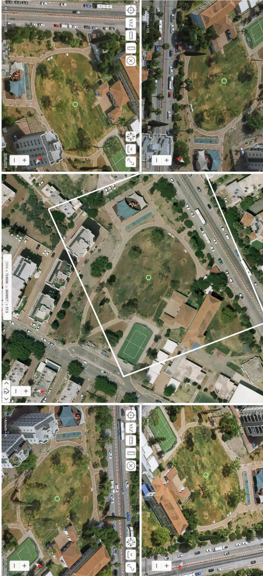
מכרז פומבי 19/2021 החברה הכלכלית לפיתוח עפולה בע"מ בחתימתנו אנו מאשרים כי קראנו הבנו ואנו מסכימים לכל האמור